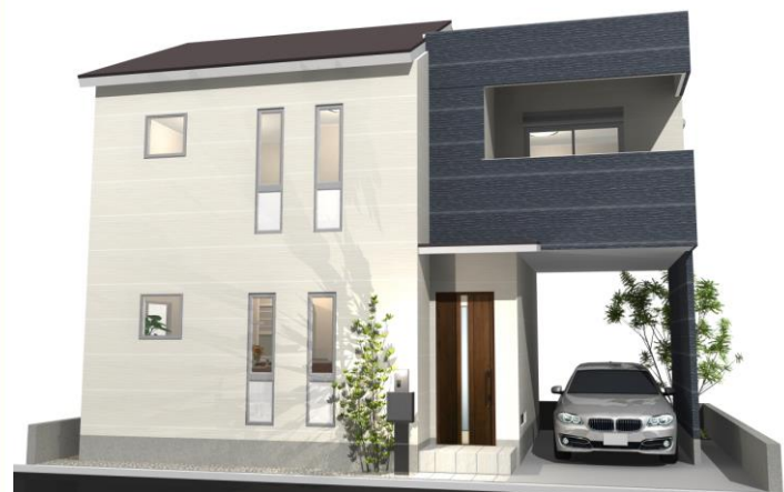
B号地 外観パース (外構・車等は含まれません)